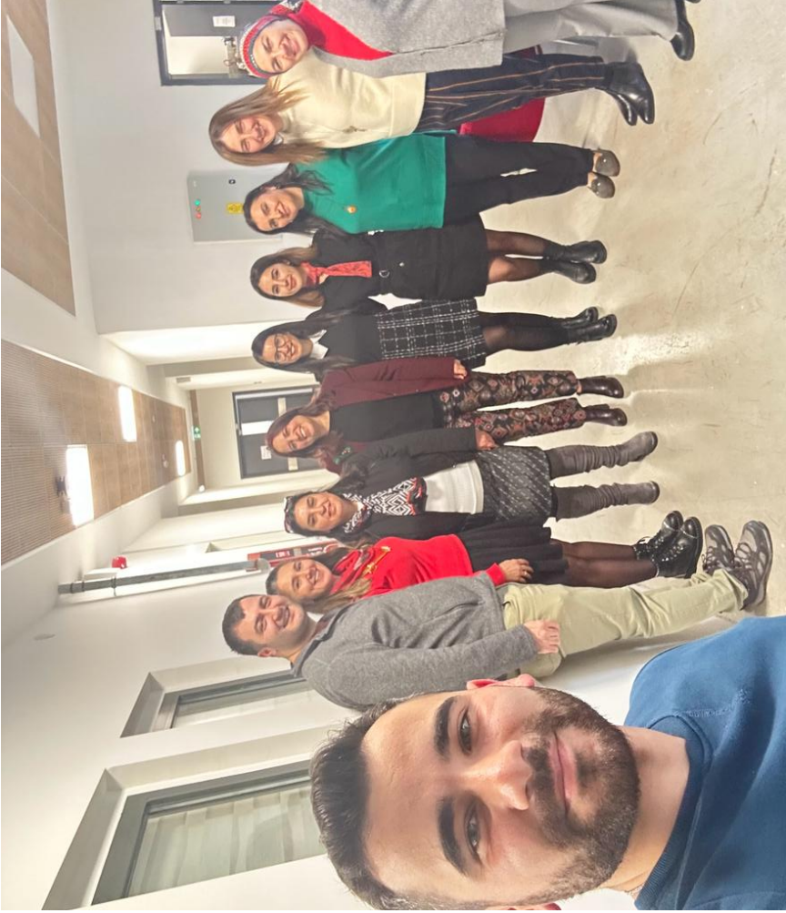
Dekanlık Personeli Yeni Yıl Partisi Hazırlıkları