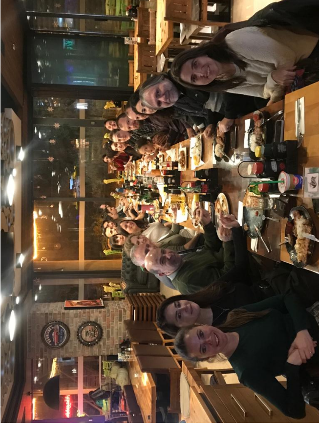
Cumhuriyetin 100. Yılı Kutlama Yemeđi