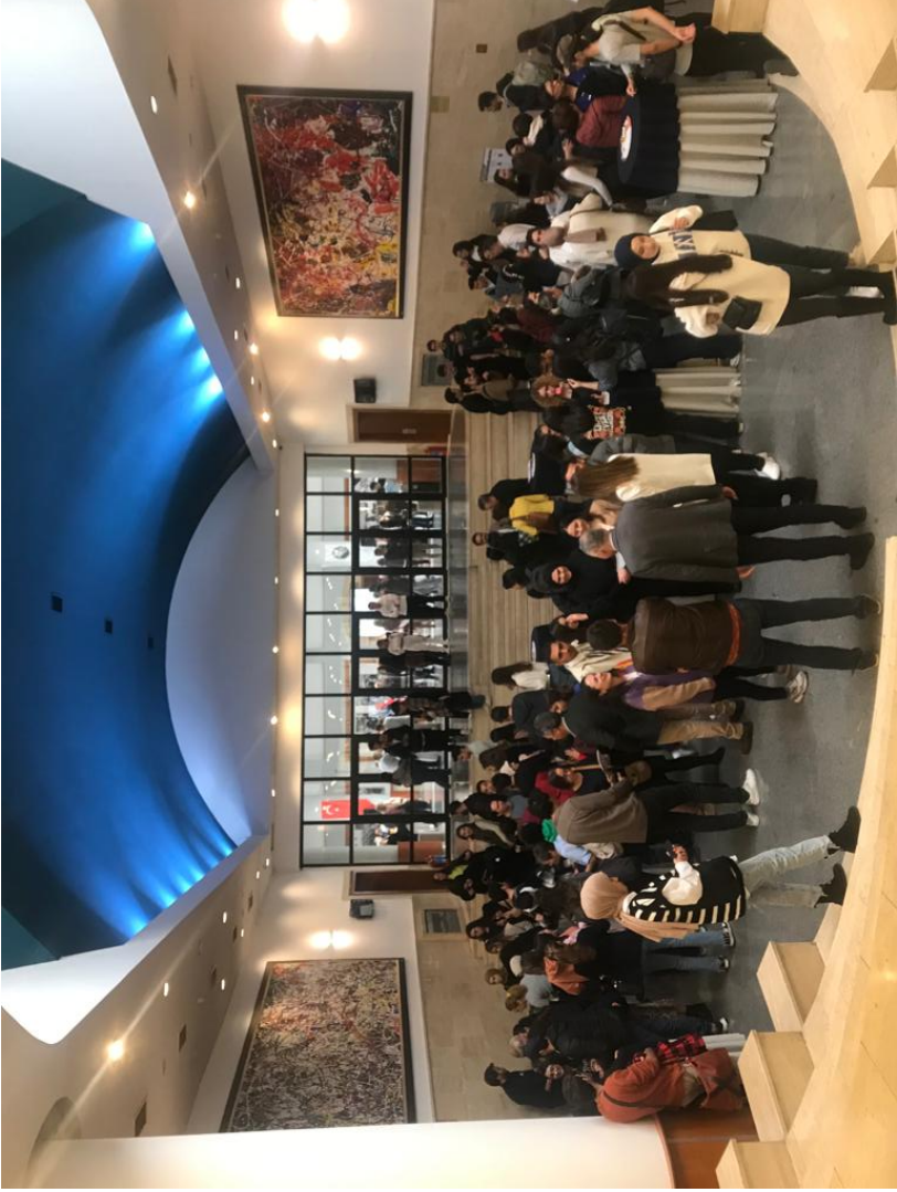
Öğretmenler Günü Etkinliği