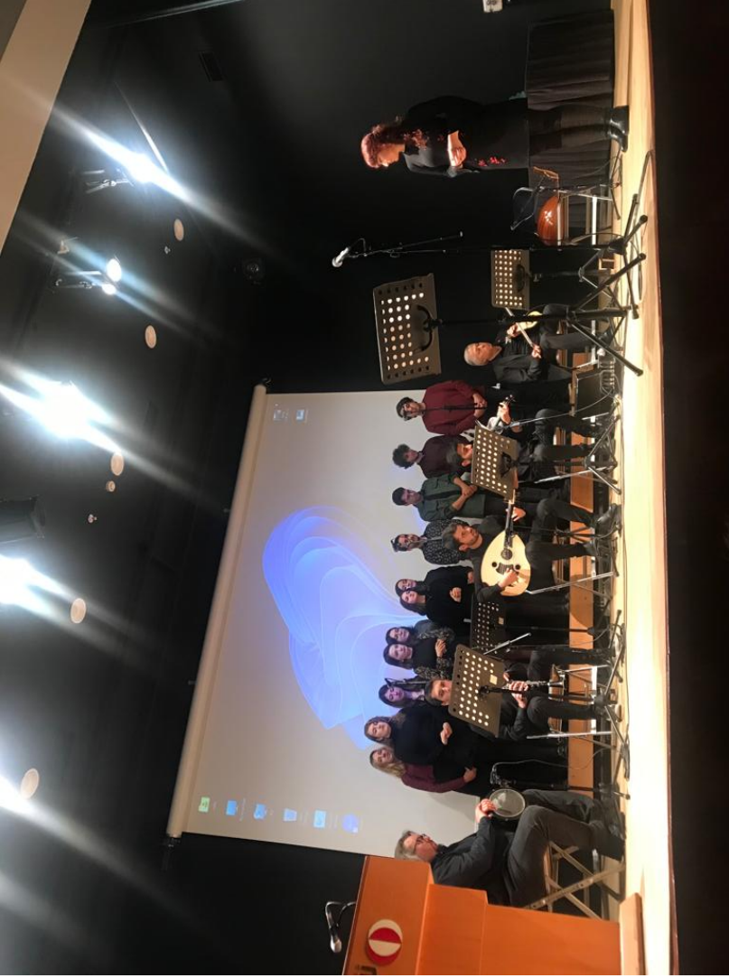
Öğretmenler Günü Etkinliği