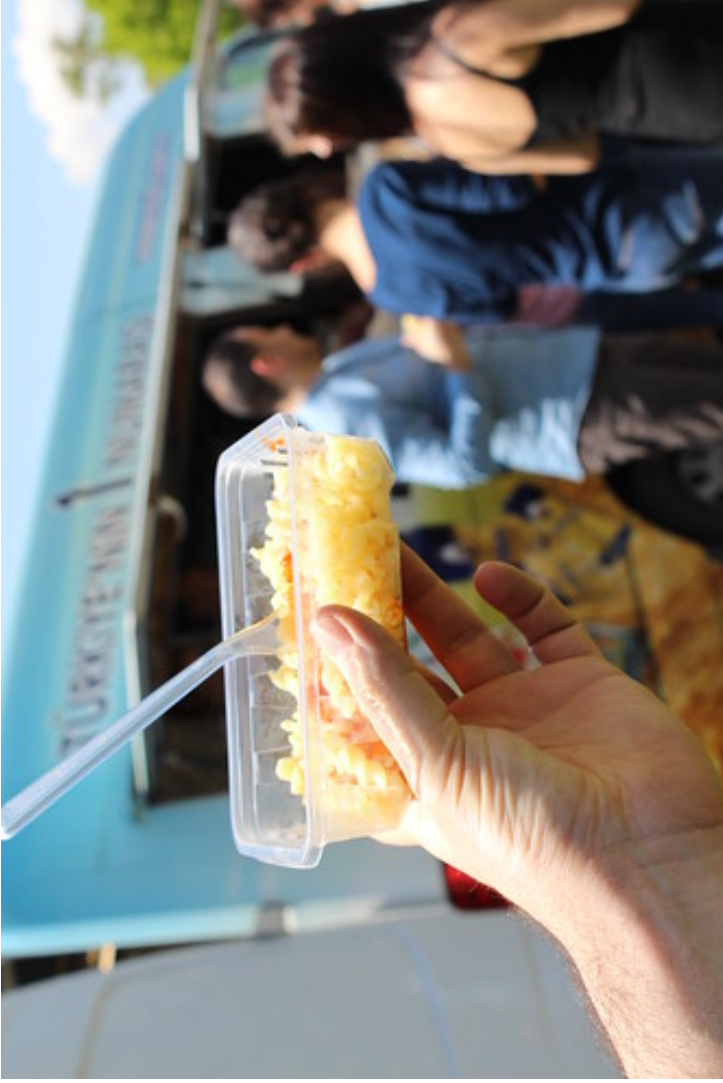
Eğitim Fakültesi Makarna Günü Etkinliği